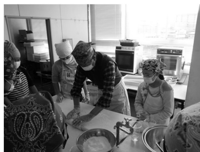
チャレンジ体験教室 （三股町）