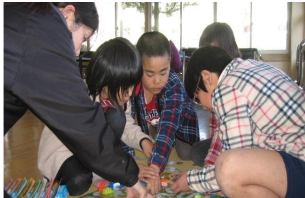
【室内でゲームをして遊ぶ様子】