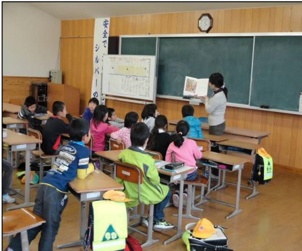
【本の読み聞かせ学習】