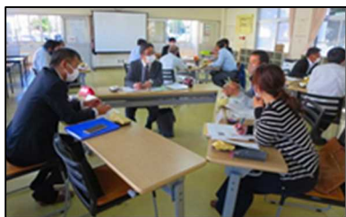
【目指す子ども像についての協議】