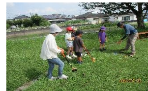
【グラウンドゴルフ体験①】