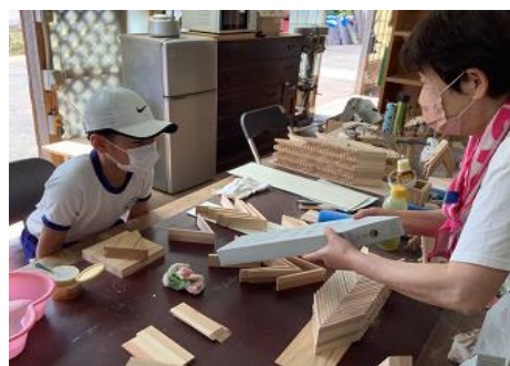
【もっくわーく那須】