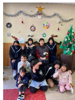
【クリスマス飾り製作】