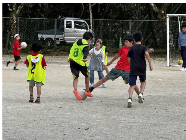
【子どもたち全員でサッカーを楽しんでいる様子】