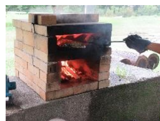
【美味しく焼けるかな】