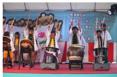
【和太鼓演奏の様子】