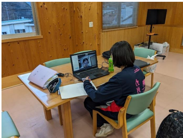
【オンラインの様子】