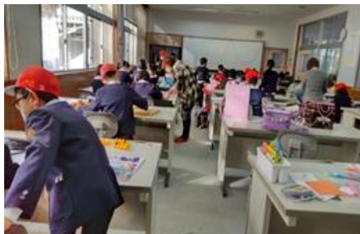
【地域の人と一緒に活動】