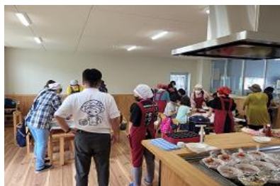
【みさとを食べよう】