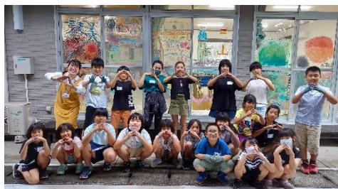
【ウィンドウアート】