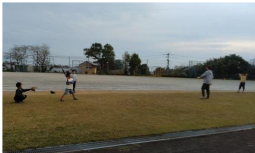
【広い校庭での遊び（野球の様子）】