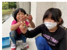
【カブトムシの飼育】