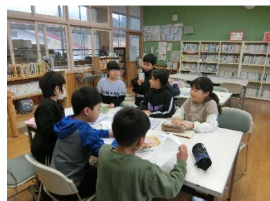
【違う学年でも仲良し】