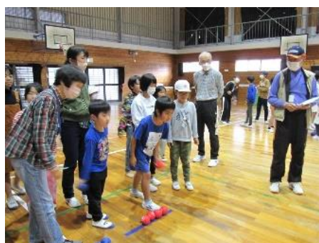
【ボッチャ体験(日南市)】

令和5年度は、本事業を活用した、放課後子供教室、地域未来塾、地域体験活動が県内14市町村で73事業が実施されました。