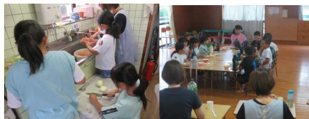
【カレー作り体験とカレーを食べる様子】