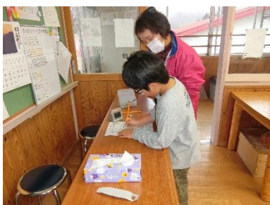
【受付は自分で行います】