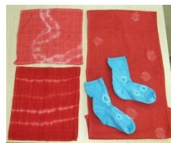
【出来上がった染め物】