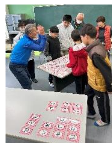
【認知症予防ゲーム】