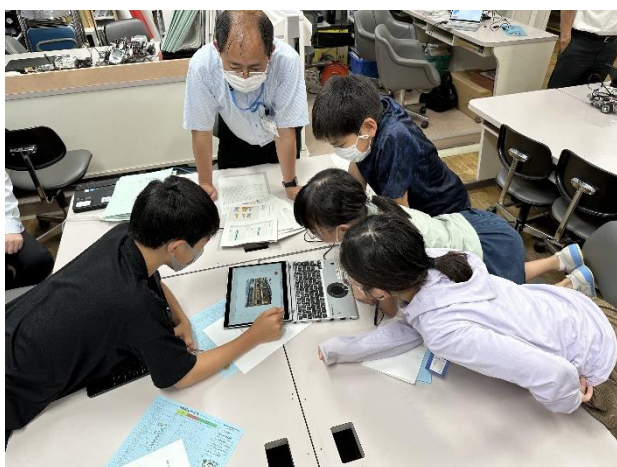
【プログラミングについて学ぶ様子】