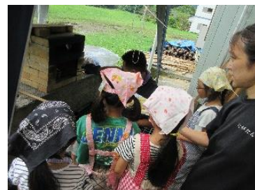
【ピザ、うまく焼けるかな】