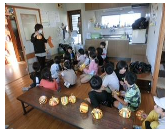
【ハロウィンのかぼちゃ作り】

・子どもたちはサポーターに手伝ってもらいながら門松を熱心に作りました。保護者の方々も喜んでくれました。（サポーター）