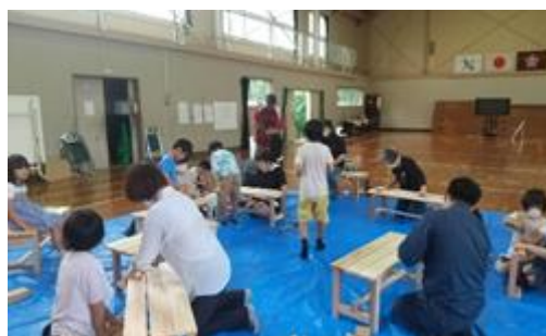
【みんなで木工教室】