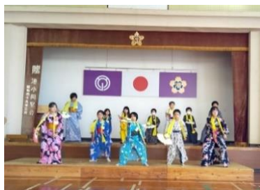
【日本舞踊の発表会】