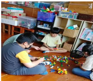
【レゴブロック遊び】