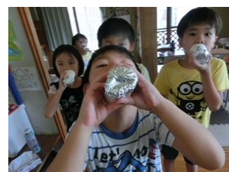
【音が大きくなる紙コップ作り】

・おもちゃ作り等が楽しいようで、製作したものを嬉しそうに自慢しており、親子のコミュニケーションとしてのツールともなっています。（保護者）