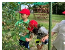
【ブルーベリーの収穫】