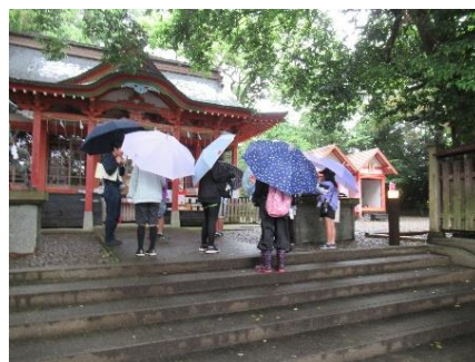
【文化財巡り（白髭神社）】