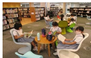
【都城市立図書館見学】