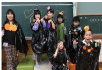
【ハロウィン衣装作り】