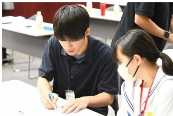
【大学生による勉強指導】