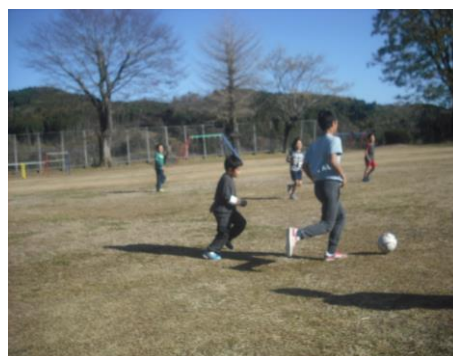
【みんなでサッカー】