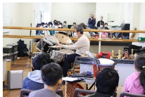
【プロの演奏にうっとり！】