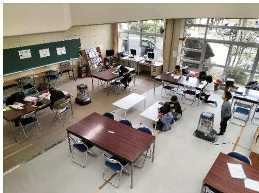
【教室での学習風景】