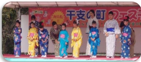
【地域のお祭りで披露した日本舞踊教室】