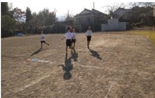
【校庭で自由に遊ぶ】