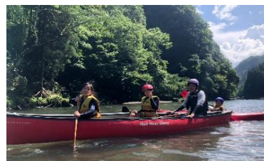
【カナディアンカヌー】