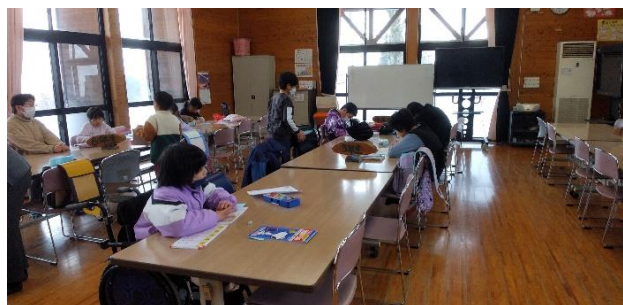
【 教室での学習風景 】