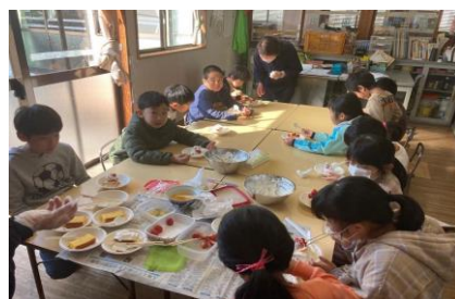
【ケーキデコレーション体験】