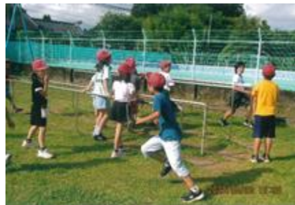
【児童クラブの友達と鬼ごっこ】