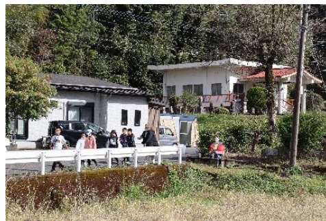
【中央が田の神様です！】