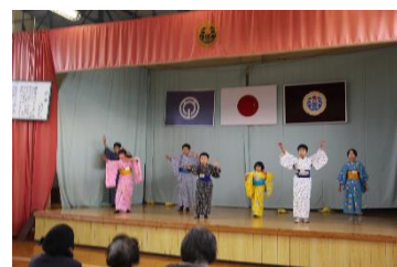
【日本舞踊の発表会】