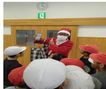
【サンタ登場の様子】