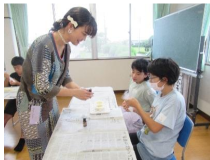
【アロマバスボム作り】