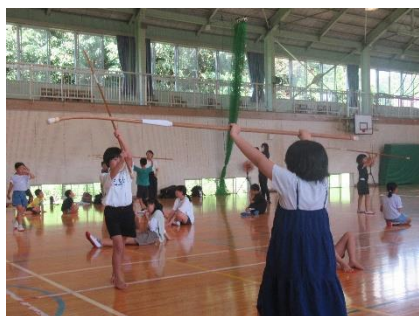
【なぎなた教室の様子】