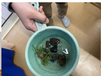
【池で捕まえたカエル】