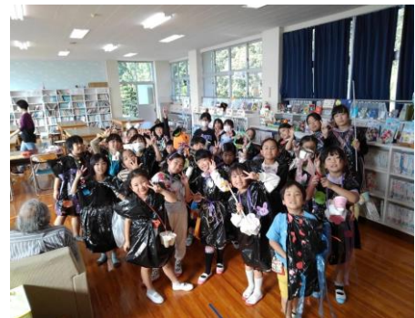
【ハロウィン、楽しかったよ】