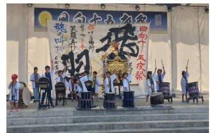
【十五夜祭での演奏、頑張りました】