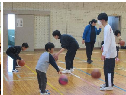
【バスケ教室の様子】