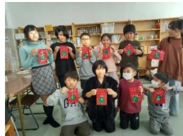
【クリスマスの飾り作り】