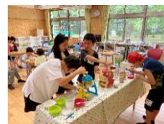
【夏休みおやつ作り】