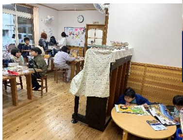
【好きな場所で勉強や読書を楽しみます】