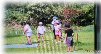
【パークゴルフ体験】