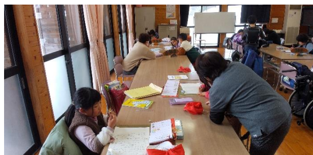
【 わからないことは何でも聞きます 】