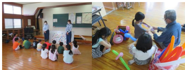
【交通安全教室とバルーンアート体験】