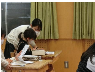
【中学生から勉強を教わることも】