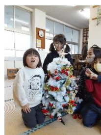
【クリスマスツリー】