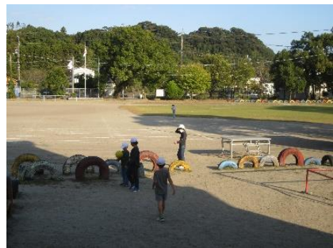
【運動場での遊びの様子】