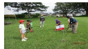
【グラウンドゴルフ体験②】