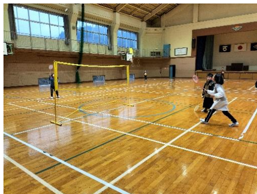
【体育館でバドミントン】