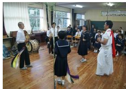
【伝統芸能（神楽）学習の様子】