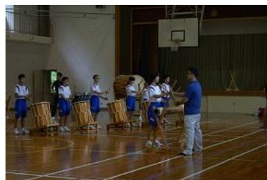
【米良太鼓指導の様子】

人口が少ない本村では、どうしても限られた人材の中での活動（支援）となるが、その分、地域と児童・生徒学校がより密接した関係を築くことができている。