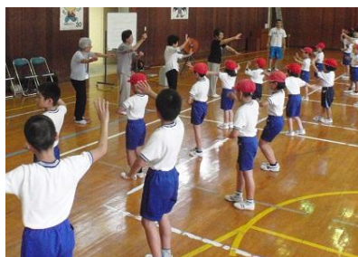
【西米良音頭練習の様子】