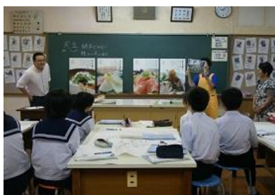
【特産品プロジェクトの様子】