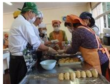
【ふるさとの食文化伝統料理教室】