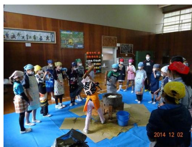
【もちつき体験の様子】