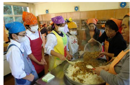
【ふるさとの食文化伝統料理教室】