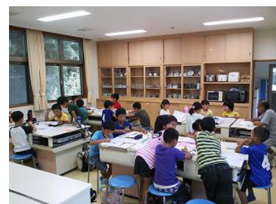
【長期休業見守りの様子】