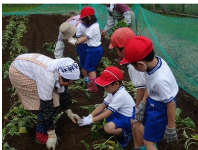
【いもの苗植え体験の様子】