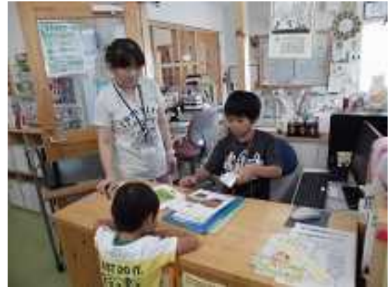
【小学生の仕事体験の様子（美郷町）】