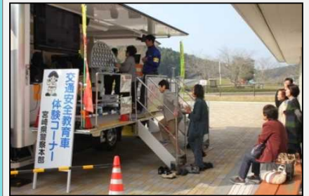
地域イベントでの出前講座