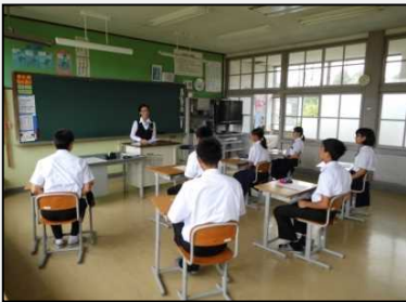
学校での職業講話