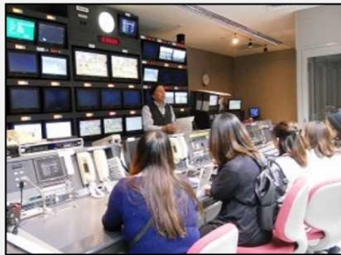
家庭教育学級での職場見学